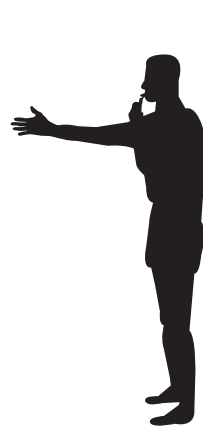
Start en hervatting van het spel (aftrap)