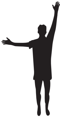
Indirecte vrije schop