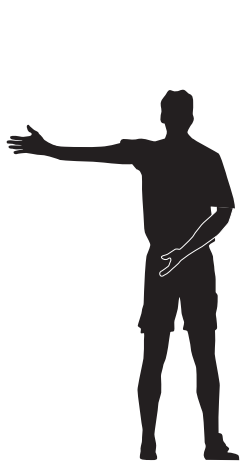
Directe vrije schop