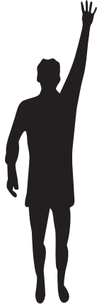
4 sec. regel